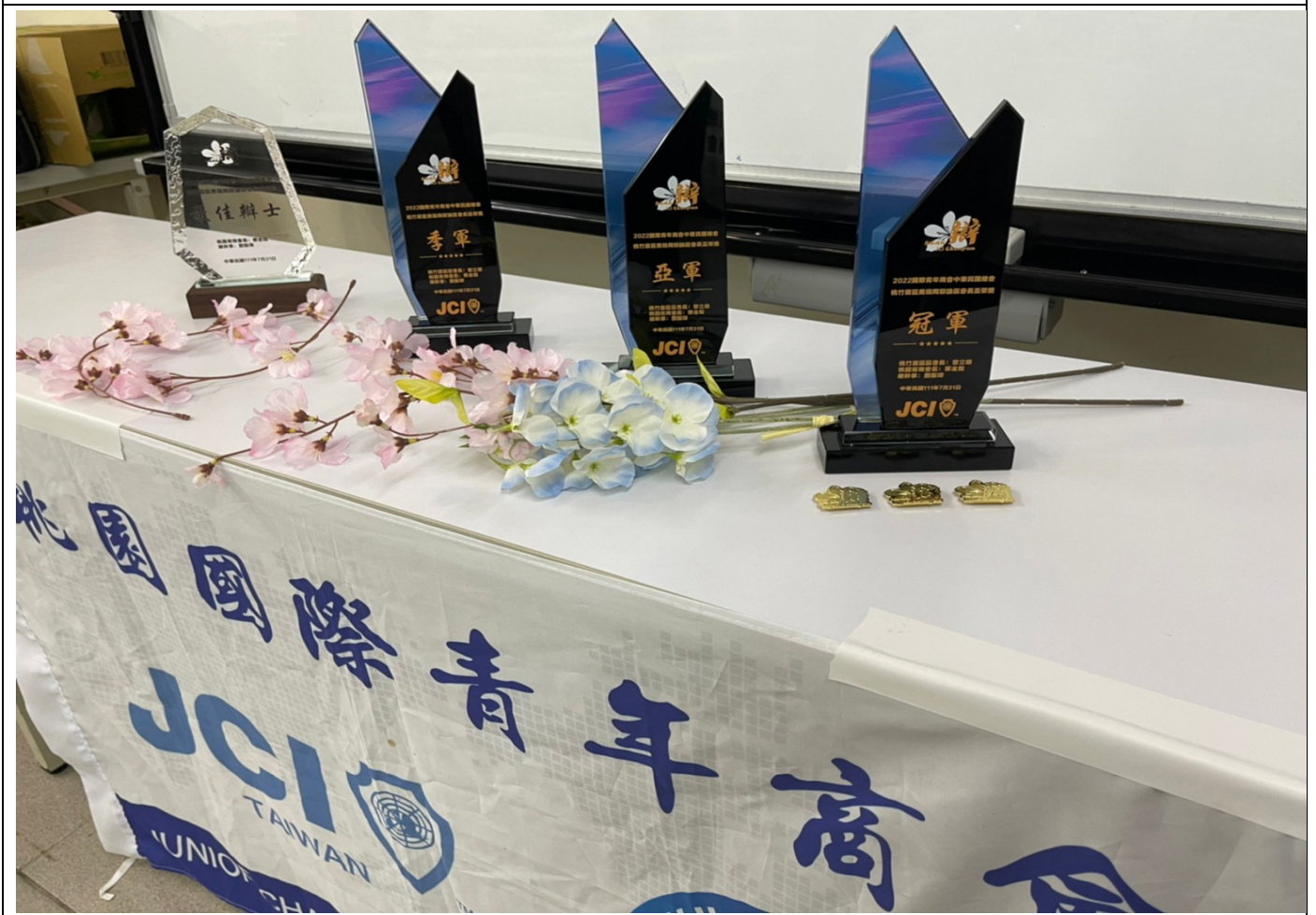
比賽流程表示意圖